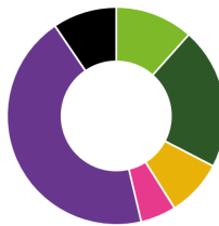
4.º TRIMESTRE DE 2023

FE CO2 (g/kWh): 185,06 (Fator de emissão de dióxido de carbono).